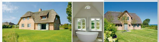
Verkleinerte Darstellung der Exposé-Anzeige