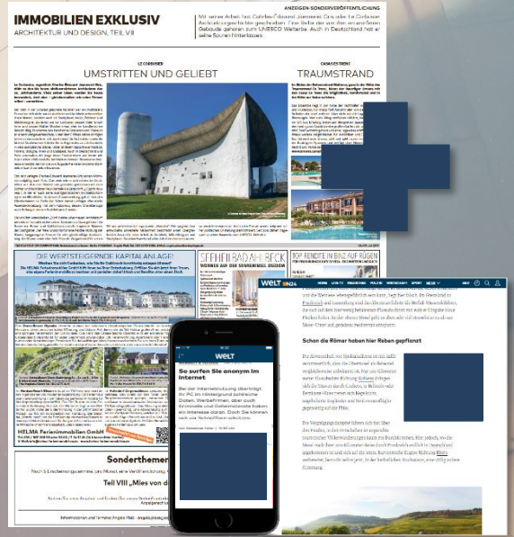
(Mobile) Medium Rectangle Maße 300 x 250 px

Ihre Anzeige steht nicht nur in Print im Rahmen einer Sonderveröffentlichung (SV), sondern wird auch digital als Medium Rectangle und Mobile Medium Rectangle auf WELT.de & WELT.de Mobil (MEW**) ausgespielt.