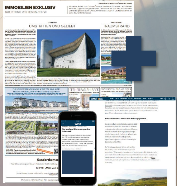
(Mobile) Medium Rectangle Maße 300 x 250 px

Ihre Anzeige steht nicht nur in Print im Rahmen einer Sonderveröffentlichung (SV), sondern wird auch digital als Medium Rectangle und Mobile Medium Rectangle auf WELT.de & WELT.de Mobil (MEW**) ausgespielt.